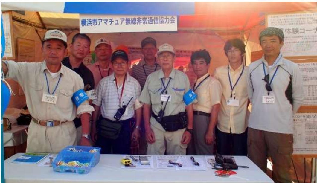
25日のブース運営各局(午後撮影)