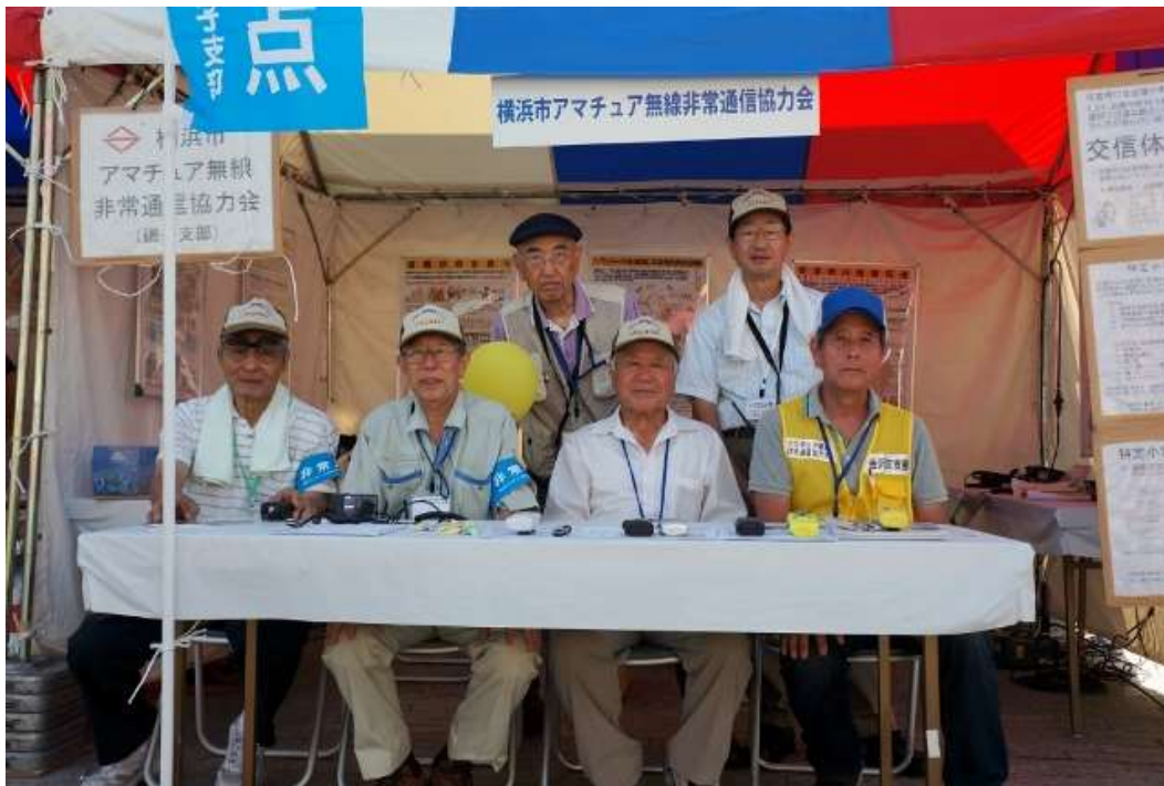
26日のブース運営各局(午後撮影)

市民が主体の災害対策ボランティア団体で唯一の出展を支えていただいているのは非常通信協力会メンバー各局です。