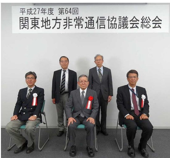
授与後の記念撮影