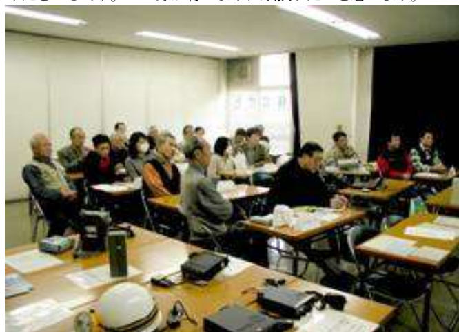
上の写真は、一般区民対象の講座風景です。

2004年は国内国外共に大災害の一年でしたが、年が変わっても福岡西方沖地震があり、東海・関東も心配されます。加えて人災も連鎖反応のごとく、ついにはJR西日本の大事故になりました。いつも後で考えると反省点は多々ありますが、後ではなく事前によく考えて対処しておくのが危機管理だと思います。それにしても最近の相次ぐ大災害にも関わらず、防災となると他人事、気持ちはあっても殆どの人が具体的には備えも行動もしていないと云うのが現状であり啓発に四苦八苦させられます。磯子支部では、災害時における情報伝達は、アマチュア無線と特定小電力トランシーバ活用との関係が効果的との考えで活動を展開しています。大災害発生直後には、火元を消し、家族の安全を確認し、次は食糧ではなく救助関係や現状把握の情報入手伝達であり、まさしく“災害時には全ての行動が情報から始まる”です。災害発生直後には遠方の人は役立たず、ご近所の助け合いが基本であり、それは情報伝達においても例外ではありません。災害時の情報を分析してみると重要で緊急な情報の殆どが近距離伝達情報です。であるなら免許不要で誰でも使える「特定小電力トランシーバ」による情報伝達が有効です。地域の町内などで、顔見知り現場の事情に詳しい住民自らが行う情報伝達によるご近所の助け合いが最も効果的だと思います。そして我々アマチュア無線が地域防災拠点などで中長距離通信を行うのは少し時間が経過してからだと思います。町内会自治会で活用する特定小電力トランシーバによる情報伝達と我々アマチュア無線とが連携することで相乗効果が得られるとの考えに基づき、磯子支部では防災訓練参加に加えて、住民へ災害時の情報伝達の重要性和特定小電力トランシーバ活用の指導に大きなウェートを置いています。平成17年になって2月には杉田劇場リハーサル室で、3月には横浜市社会教育コーナーで、一般区民に対して講座を行いました。そして住民自ら災害時の情報伝達をやらうと云う芽が出かけたところ。この芽が育つように頑張りたいと思います。